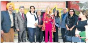
ਮਿਸ ਇੰਗਲੈਂਡ ਵ ਵਿਦੇਸ਼ੀ ਮੇਹਮਾਨਾਂ ਦੇ ਕੋਰਡੀਆ ਦੇ ਪ੍ਰਬੰਧਕ ਵ ਸਟਾਫ।