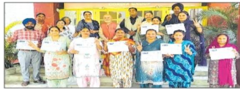
सिखलाਈ ਹਾਸਲ ਕਰ ਚੁੱਕੀਆਂ ਔਰਤਾਂ ਕਾਲਜ ਪ੍ਰਬੰਧਕਾਂ ਨਾਲ ਯਾਦਗਾਰੀ ਤਸਵੀਰ ਦੌਰਾਨ।