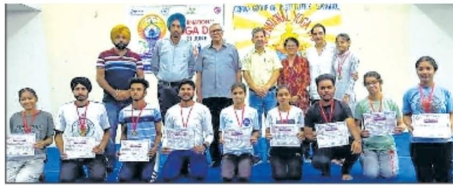
ਯੋਗ ਪ੍ਰੋਗਰਾਮ 'ਚ ਹਿੱਸਾ ਲੈਣ ਵਾਲੇ ਵਿਦਿਆਰਥੀ ਅਤੇ ਸਟਾਫ਼।